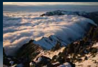
2022年度 奨励賞 「槍ヶ岳西鎌尾根大瀑布」大谷博志

山岳写真をテーマとした創作、研究、発表などの活動をしています が、山岳写真愛好家に発表の場を開くため、一般公募を行います。入 賞作品は東京都美術館で開催する「日本山岳写真協会展」に展示し ます。東京都美術館は世界と日本の芸術作品も展示される日本の美 術の殿堂です。皆様も歴史ある大舞台で作品を発表してみませんか。